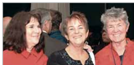
Los presentadores de los servicios para mujeres de Phoenix House: "Contentos de estar aquí y de compartir nuestras experiencias en el tratamiento de mujeres con problemas de aprendizaje."

de tratamiento alrededor del mundo y ha sido traducida en más de 30 idiomas. El Señor Beauvais, quien escribió la filosofía en 1964 habló del corazón honrando a Daytop y a todos aquellos quienes subsisten por los conceptos en la filosofía. El señor Beauvais fue seguido por la interpretación musical de la filosofía conducida por Norman Graves y cantada por el Coro de Daytop, jóvenes adolescentes en tratamiento. La filosofía de la CT une a individuos en un propósito común; es pura inspiración, poesía y un dogma por el cual vivir. La noche apenas ha comenzado!